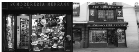
Barreteria Medrano, fundada el 1832 al carrer Imperial

Les dates cèlebres del regnat de Isabel II estan marcades a la novel·la amb la successió dels parts de Isabel Cordero de Arnáiz, cunyada de Barbarita i mare de Jacinta: “Mi primer hijo —decía— nació cuando vino la tropa carlista hasta las tapias de Madrid. Mi Jacinta nació cuando