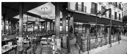
El Café Comercial, fundat l'any 1887 a la Glorieta de Bilbao, núm. 7