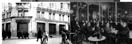
El Café de Fornos fundat el 1870 al carrer d'Alcalá. Avui una placa en recorda la ubicació