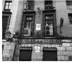
La casa de Fortunata en l'actualitat, situada a la Cava de San Miguel, núm.11

parecían destinadas a la premeditación de algún crimen”, (p. 23). I no era aquest dels pitjors habitatges —“Bàrbara no era pobre”, ja que estava situat al mateix barri on ella mateixa viuria després de casar-se amb Don Baldomero, una casa gran i luxosa situada al número 1 de la plaça de Pontejos: “Ocupaban los dueños el piso principal, que era inmenso, con doce balcones a la calle y mucha comodidad interior”, con “número sobrado de habitaciones, todas en un solo andar desde el salón a la cocina”. Per tant, en aquesta casa vivia la família protagonista de la novel·la que més representa la burgesia capitalina de final de segle XIX.