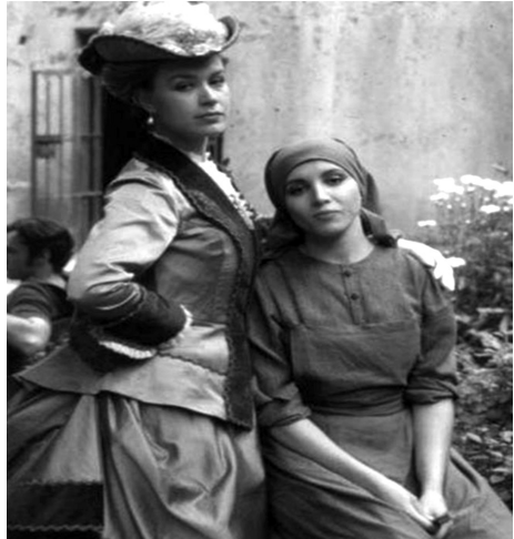
Ana Belén en el paper de Fortunata i Maribel Martín en el de Jacinta en la sèrie televisiva