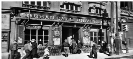
El Gran Café Universal, fundat el 1861 al número 15 de la Puerta del Sol

El Madrid de Galdós, encara que òbviament diferent, és avui recognoscible. Els edificis i alguns establiments de la zona on transcorre Fortunata y Jacinta , incloses les cases on Galdós va situar l'una protagonista i l'altra, estan gairebé igual. Per tant, Galdós fa una completa descripció de les diferències en la societat del XIX i ho fa no tan sols a través dels personatges, sinó també dels seus habitatges. Com les dues cases en què va habitar durant la seva vida la mare de Juanito, Barbarita i, per descomptat, en la segona també va viure la seva nora Jacinta. Ella “Nació en la calle de Postas, esquina al callejón de San Cristóbal, en uno de aquellos oprimidos edificios que parecen estuches o casas de muñecas”, on “los techos se cogían con la mano; las escaleras había que subirlas con el credo en la boca, y las habitaciones