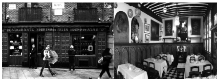
Entrada actual del Restaurant Sobrino de Botín